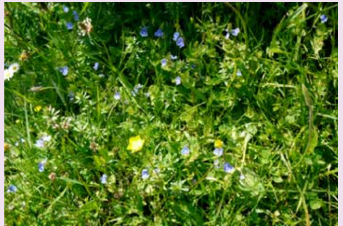
Gedanken und Foto: Albrecht Widmann

Dies ist der Tag O Herr, hilf! O Herr, lass wohlgelingen! Gelobt sei, der da kommt im Namen des Herrn! Wir segnen euch vom Haus des Herrn. Der Herr ist Gott, der uns erleuchtet. Schmückt das Fest mit Maien! Du bist mein Gott, und ich danke dir; mein Gott, ich will dich preisen. Danket dem Herrn, denn er ist freundlich, und seine Güte währet ewiglich.